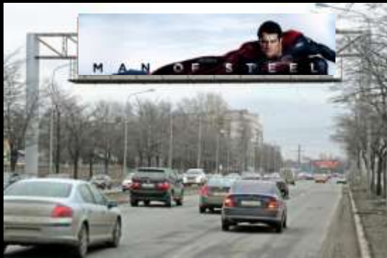
Арки 24*5 в Санкт - Петербурге