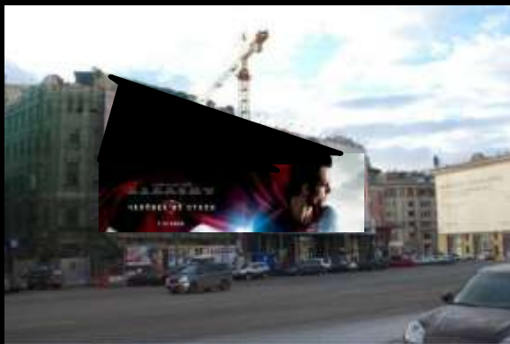
Брендмауэры в Москве