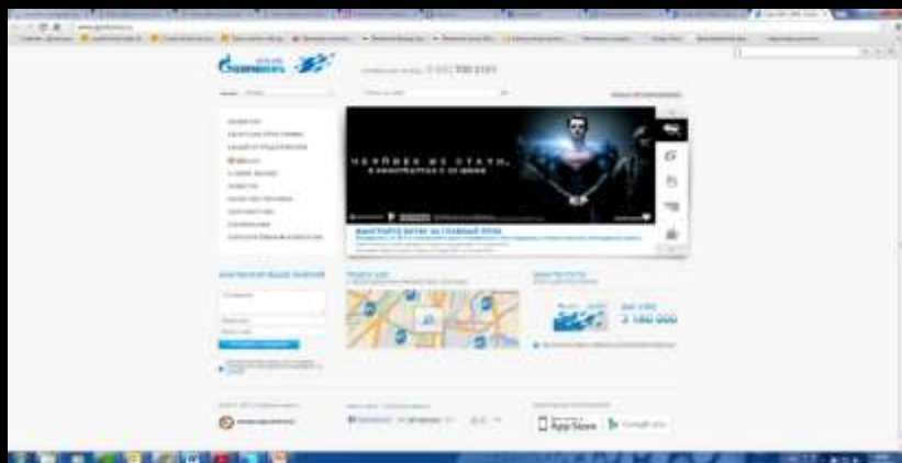
Сеть АЗС «Газпромнефть»